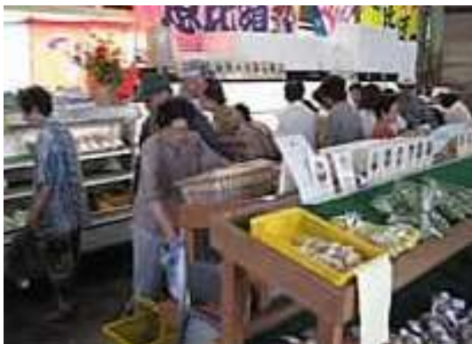
たちばな漁協の朝市