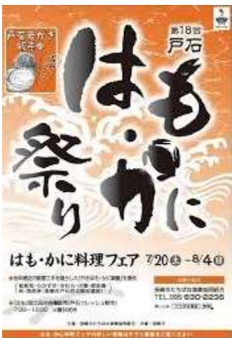
戸石はも・かに祭り