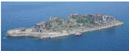
明治日本の産業革命遺産(端島炭鉱)

これら市内各地の観光拠点へのアクセスとして港湾・漁港を拠点とする海上ルートが重要な役割を果たしており、更に長崎県西部の美しい海岸沿いの道路「ながさきサンセットロード」と連携し、広域観光ルートが形成されているが、これらの重要な拠点となっている港湾・漁港は、老朽化等が進み、今後は船の安全な運航に支障が生じる恐れがある。