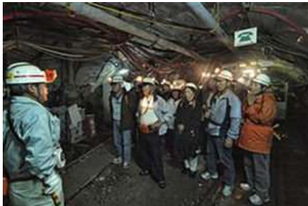
池島炭鉱坑内体験ツアー