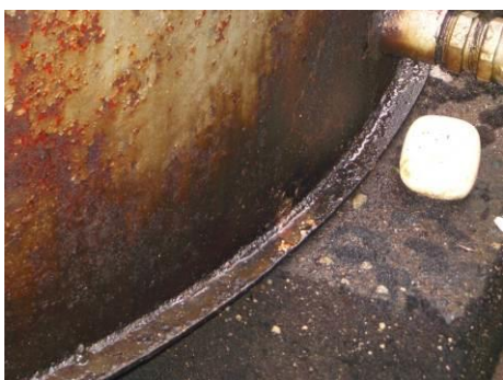
①. 重油タンクの腐食