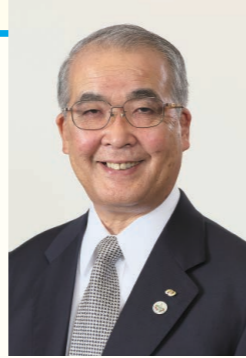
長崎県知事 中村 法道 令和2年6月

この大きな変化をチャンスと捉え、本県のさらなる地域活性化を図り、県民の皆様が夢や希望を持ち、若者の皆様が活躍できるよう、たくましく、そして魅力ある長崎県づくりに全力で取り組んでまいります。