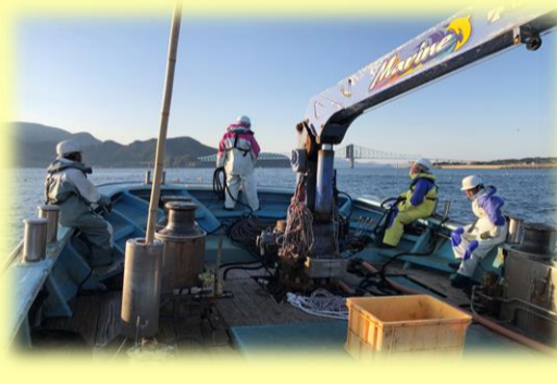
先輩たちとのコミュニケーション

5時に起床し、6時前後に漁港に集合します。朝食を摂り、出港、8時～9時頃帰港し、選別作業や網補修作業を行います。朝食と昼食は専用の食堂で乗組員揃って食べます。とてもおいしいご飯が食べられますよ。また、入網状況により午後の操業が無い日もあります。