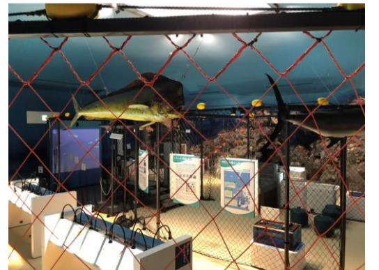
島の館（定置網ブース）