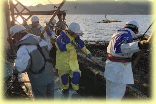
入網した魚をすくいます。