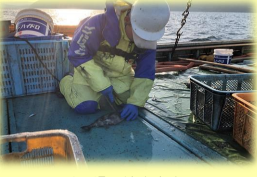
その場で締めます。