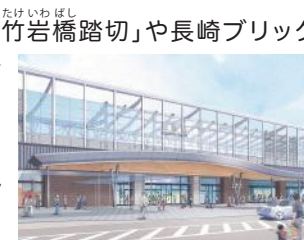
新しい長崎駅(西口)のイメージ図

また、東西市街地の一体化が図られることで、まち全体のさらなる発展やにぎわいの創出などが期待されます。