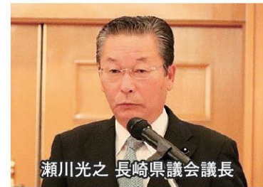
瀬川光之 長崎県議会議長