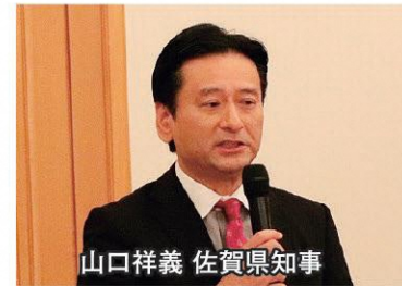
山口祥義 佐賀県知事