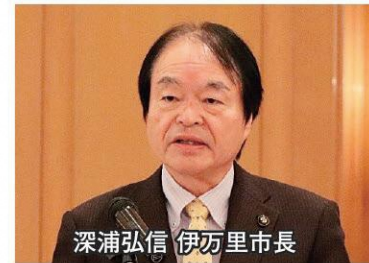
深浦弘信 伊万里市長