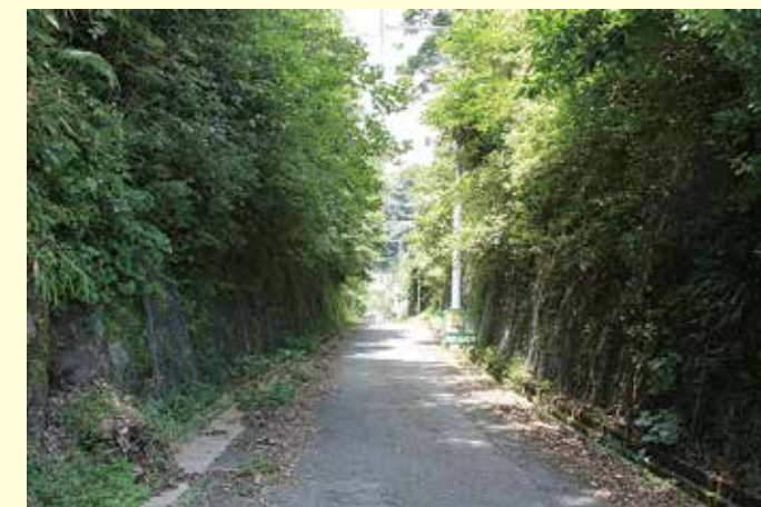
現在の日見峠切通し

時代は大正時代になり、自動車交通に対応できなくなった日見峠切通しに代わって、峠の下に造られた日見隧道が幹線道路になった。しかし当時の日見新道は今でもほぼ全線当時の状態で残されている。日見峠切通の見上げるような切り立った両側の斜面は、困難を極めた土木工事の姿を今に伝えている。