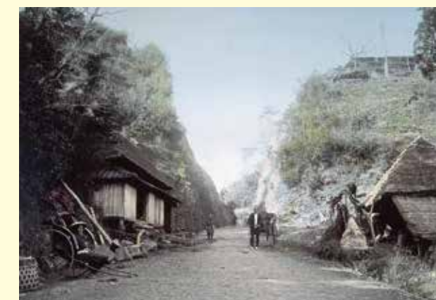
開通直後の日見峠切通し