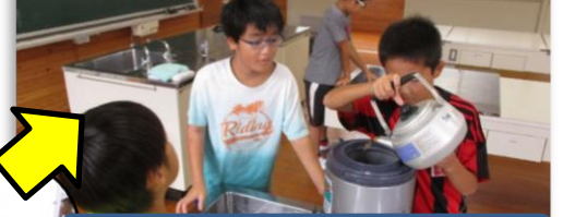
家庭科での学びを生かしたおもてなし用の麦茶づくり