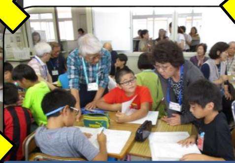
大先輩との交流会(1回目)