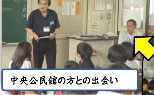
中央公民館の方との出会い