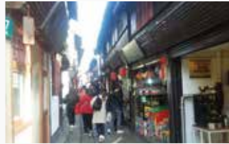
土産品店などの散策も楽しい