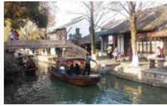
遊覧船での運河巡り

遊覧船に乗ったり、寺院や史跡巡りを楽しめるほか、メインストリートには漬物やお菓子、ちまきなどを売る素朴な土産品店が数多く軒を連ねます。また、おしゃれなカフェやレストランも立ち並び、1日をかけてゆったりと過ごすことができます。ぜひ朱家角に足を運んでみませんか。