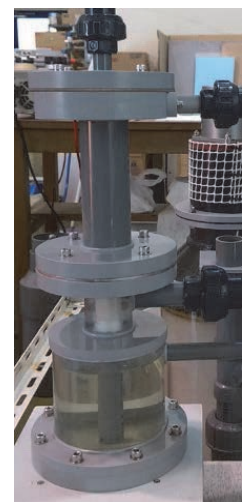
図1 解析に使用した電解槽外観(試作品)

流れの解析は、スケールが析出する陰極水のみを限定し、2次元モデルを作成して計算した。