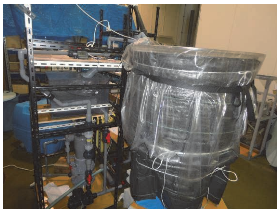
図2 クエ飼育システム外観