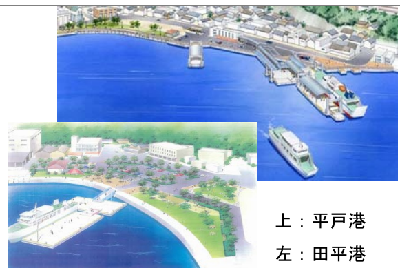
上：平戸港 左：田平港