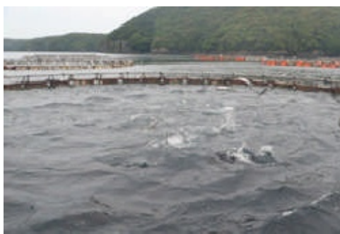
養殖マグロ「トロの華」のいけす