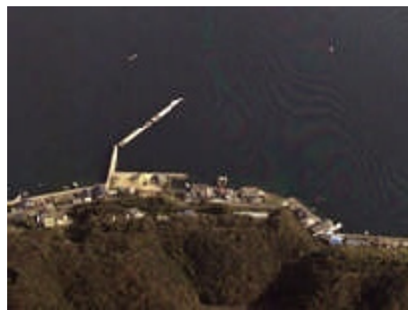
竹敷港 （浮棧橋を整備し利便性の向上を図る）