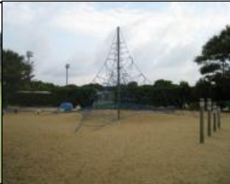
③ ザイルクライミング