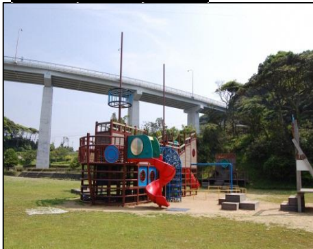
① コンビネーション遊具