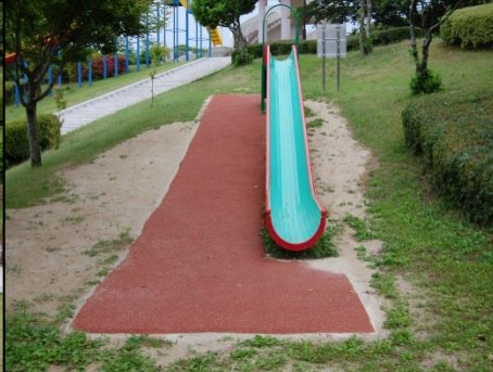
⑪ ジェットスライダー(小)