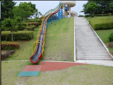
⑩ ジェットスライダー(大)