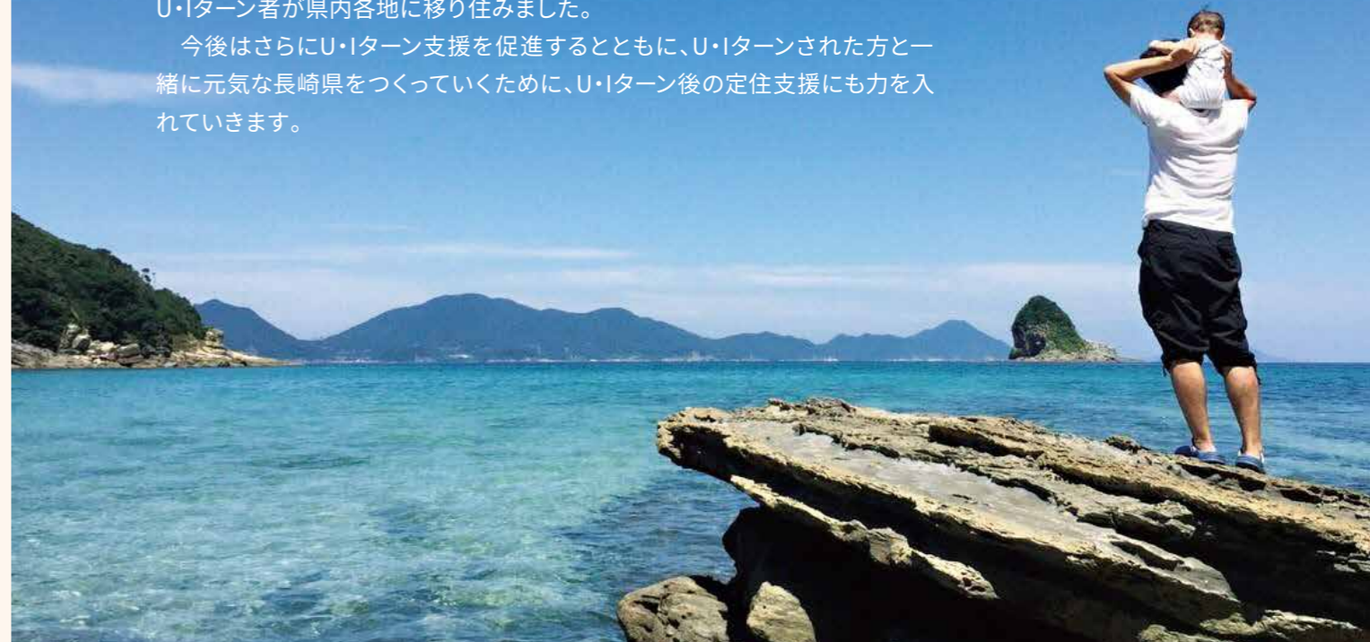
ハマナナ(新上五島町)

今後はさらにU・Iターン支援を促進するとともに、U・Iターンされた方と一緒に元気な長崎県をつくっていくために、U・Iターン後の定住支援にも力を入れていきます。