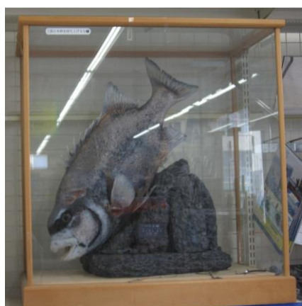
佐世保市内の釣具店に展示してある7.6kgの立派なイシダイ剥製