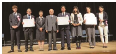
H28 年度企業等表彰 《大賞》 損害保険ジャパン日本興亜(株)長崎支店 《優秀賞》(株)ウィンブランツ (株)ジャパネットビジネスアソシエイツ