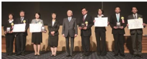
H27 年度企業等表彰 《大賞》 九州教具(株) 長崎ダイヤモンドスタッフ(株) (株)日本政策金融公庫長崎支店 《奨励賞》(株)新長崎製作所

女性の登用や能力開発等に積極的に取り組んでいる企業・団体等を表彰しています。この取組を広く周知することにより、企業等において男女ともにそれぞれの能力を發揮できる「誰もが働きやすい職場環境の整備」を促し、県内企業の魅力を伝えていくことが目的です。