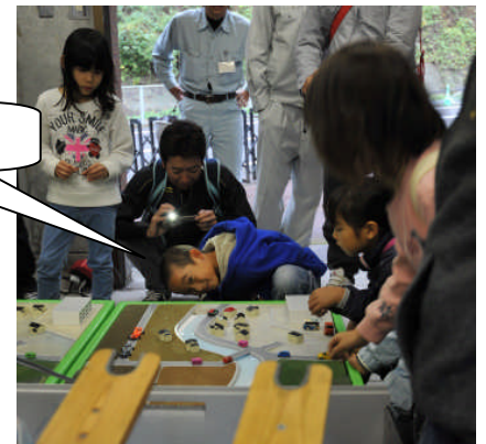
こども達に大人気だったダム模型実験