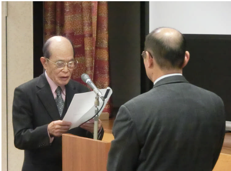
要望書を読み上げられる西坂会長(左)と、里見副知事(右)