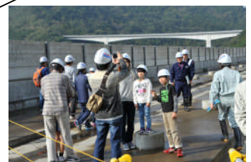
あちらこちらからシャッター音が...

参加していただいた皆さんに「土木」を体験していただける良い機会となったと思います。