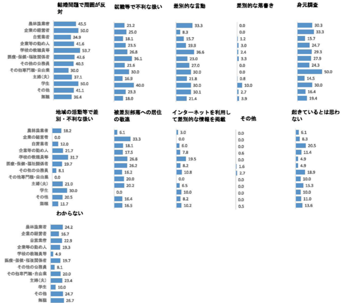
図 2 1-5 職業別

職業別で上位 3 項目を個別で見ると、「結婚問題で周囲が反対」は学校の教職員等 53.7%、「差別的な言動」は学校の教職員等 36.6%、「就職等で不利な扱い」は学生 40.0%がそれぞれ最も多くなっている。