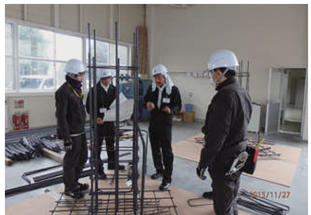
～鉄筋工養成講座の様子～ 担い手の確保・育成に取り組めます