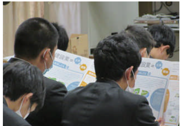
～高校訪問の様子～ 土木・建築の魅力を伝えます