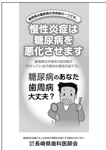
(糖尿病のあなた 歯周病大丈夫？ リーフレット) 平成22年度作成