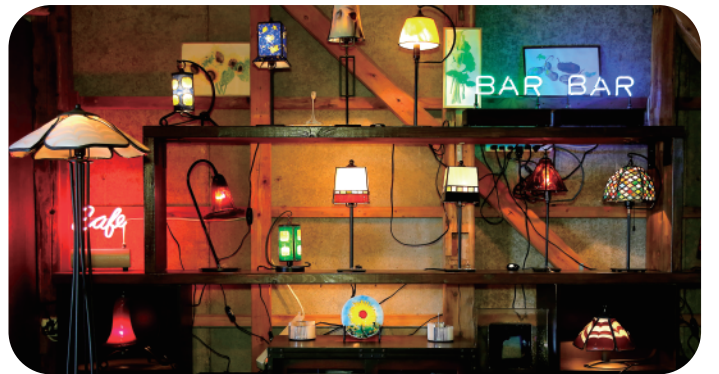
ルナ・イエナ 平戸市生月町南発4387 ☎0950-21-5023