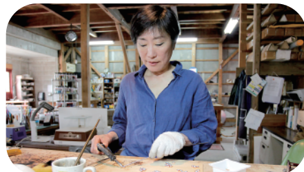
手間暇をかけて作り上げるステンドグラスは、一つ一つの作業を通して作家の魂が込められます

「平戸市生月島にある ガラス工房で、 心までホッと 明るくなる ステキな灯りに 出会いました」