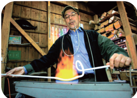
赤い炎で熱せられたガラスのチューブは、熟練の技によって自在に形を変えていきます