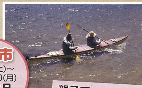
親子で シーカヤック体験