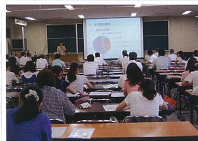
N I E 研修の様子