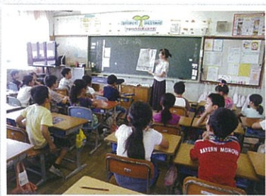
長崎市立福田小学校での授業の様子