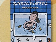
「おかあさん だいすきだよ」金の星社