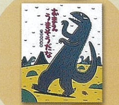
「おまえ うまそうだな」ポプラ社

第1部 13:15~14:00 おはなし広場 第2部 14:20~15:40 宮西達也の絵本ライブ