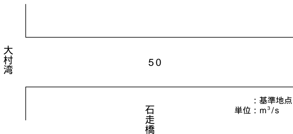
よし川計画流量配分図

よし川における計画高水流量は、石走橋基準地点において 50\text{ m}^3/\text{s} とする。