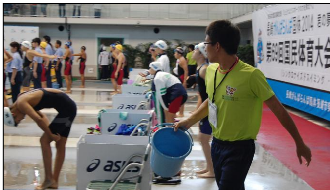
スタート前に選手が使用する水を準備しています。