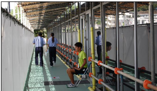
立ち入り禁止区域の管理をしています。