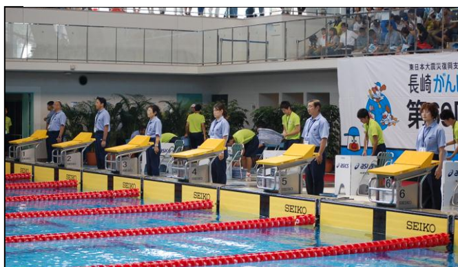
選手の衣類を運搬しています。