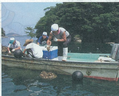
中間育成のようす (西彼町)

ナマコは、稚ナマコを中間育成してから放流します。 平成15年に大村湾で獲れたナマコは249トンです。