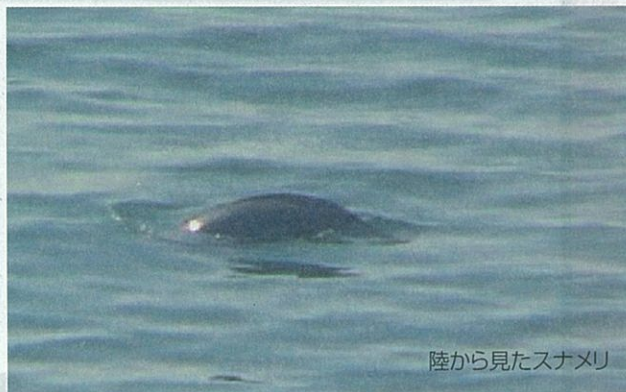
陸から見たスナメリ