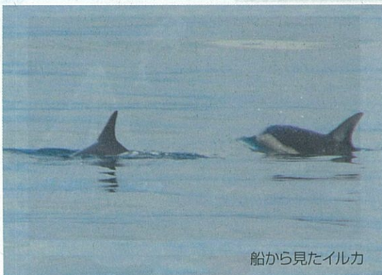
船から見たイルカ