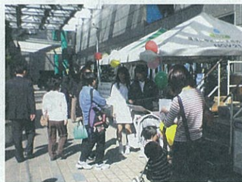
昨年のような（静岡県）

10月21日～23日の3日間、 佐世保市のハウステンボス で開催します。子どもたち によるスナメリについての 活動発表など、盛りたくさ んのイベントがあります。