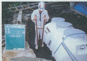
浄化槽の設置工事(西彼町)