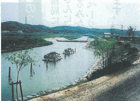
幡鉾川（吉崎市）での整備のようす（参考）

郡川、よし川（大村市）、川棚川（川棚町）、長与 川、高田川（長与町）、時津川（時津町）で、護岸を 緩やかな傾斜にしたり、魚が棲めるブロックを使用 したり、植物が育ちやすいように自然石を利用 するなど、環境に配慮した川づくりを進めます。