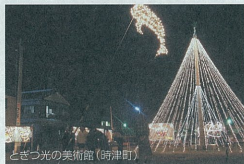
とぎつ光の美術館(時津町)

いさはやエコフェスタ(諫早市)、 エコシップ事業(佐世保市)、 大村湾ウォッチング(大村市)、 大村湾フローティングスクール(県)、 スナメリと共にくらせる湖(うみ) づくり大会(県)、 とぎつ光の美術館(時津町)、 廃油石けんづくり(諫早市)、 ふるさと文化環境発見事業(佐世保市)、 やさしい環境講座(大村市)、 リバーウォッチング (水生生物調査) (諫早市、大村市、 東彼杵町、川棚町)、 など多くの事業が 開催されました。