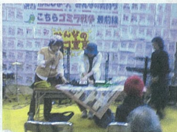
昨年のような（静岡県）

ごみの減量化やリサイクル について考えるため、「環境フ ェスタ in ハウステンボス」の メインイベントとして10月21 日に開催します。ごみを減ら すために活動している人たち が、全国各地から参加します。