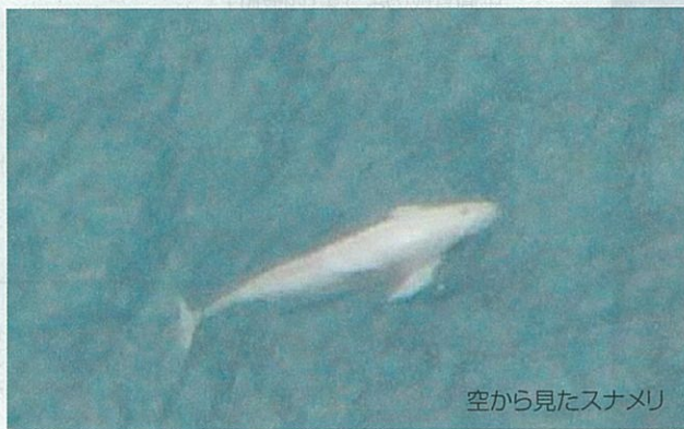
空から見たスナメリ

空からの調査では、2時間前後のフライトで毎回スナメリを見ることができました。目撃場所や頭数などから、スナメリが大村湾に何頭くらいいるのか?などの調査に役立てます。 船からの調査では、波の状態がとても大事であることが分かりました。波が静かでないときスナメリは見えません。海面が鏡のような状態がベストです。 また、陸からでもスナメリを見ることができると確認できました。大村湾岸の眺めのよい場所からなら、意外とスナメリを見ることが出来ます。