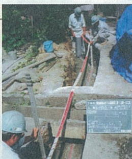
下水道管の敷設工事(琴海町)

これによって、大村湾の生活排水処理率 (台所やお風呂などの排水をそのまま流 さずに、下水道などできれいに処理して 大村湾に流している人の割合)が2%程 度上がり、83%程度になる見込みです。