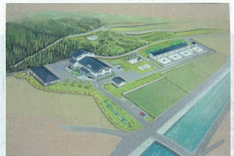
琴海南部浄化センター完成予想図

下水処理場や下水管を整備して処理できる範 囲を拡げていきます。各家庭に設置する浄化槽 の整備を進めます。琴海町では、公共下水道が 新たに供用開始となり、約4000人の下水が処理 できるようになる予定です。