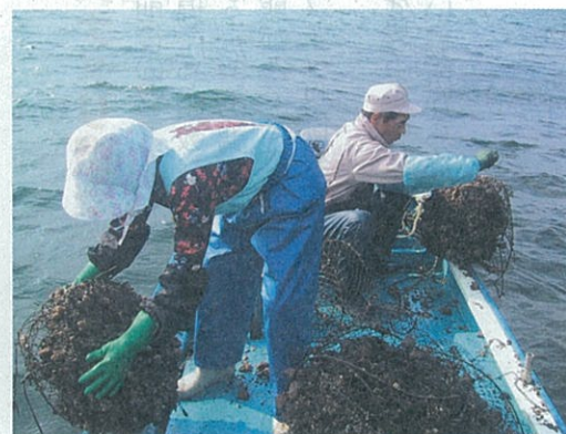
放流のようす (東彼杵町)