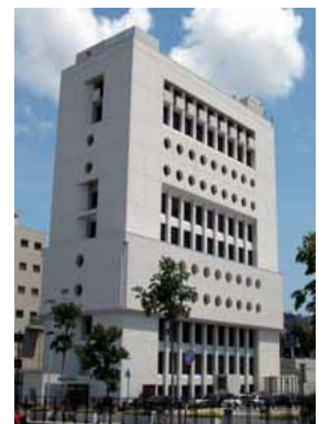
出島交流会館外観 (長崎県美術館ココ 白い建物です。)

(交通アクセス) 路面電車 「出島」または「市民病院前」 徒歩約5分 長崎バス 「長崎新地ターミナル」 徒歩約5分 長崎・県営バス「大波止」 徒歩約10分