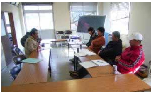
甕島漁協上甕支所での視察模様

視察先からは、水揚げ後速やかに内蔵を取り出せば、イスズミ特有の「臭い」が軽減できるとの知見を得ました。