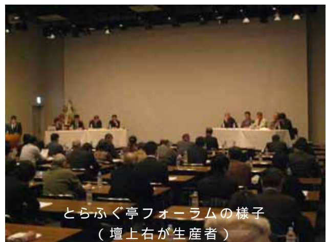
とらふぐ亭フォーラムの様子 (壇上右が生産者)