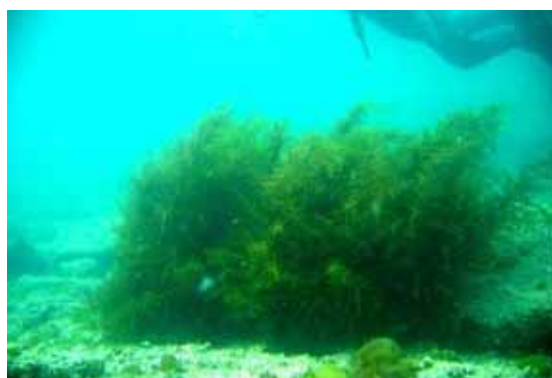
ブロック上で順調に生育している海藻（ヨレモク）