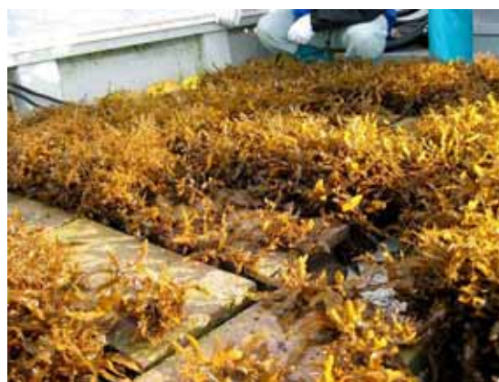
海藻の種をつけたブロック

海藻が消失する「磯焼け」が問題となっている佐世保市小佐々町、鹿町町、平戸市志々伎、度島、小値賀町等では、その対策として、青年部や潜水部会等が中心となって、海藻の芽を食べるガンガゼから海藻を守るための駆除、駆除した場所に再び侵入しないようにウニフェンスを設置しての海藻の保護、海藻の種をつけたブロックの設置や母藻の投入等、藻場を回復させる様々