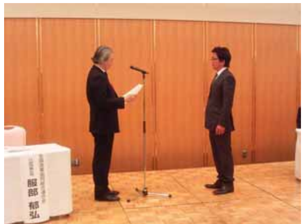
全国漁連海面魚類養殖業対策協議会 会長賞を受賞しました