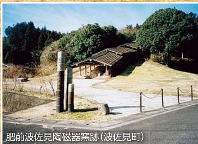
肥前波佐見陶磁器窯跡(波佐見町)