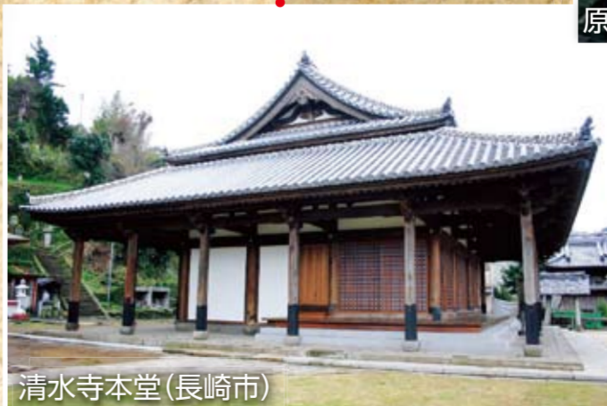
清水寺本堂(長崎市)