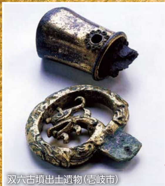
双穴古墳出土遺物(宍岐市)

※文化庁では、国民の文化財に関する理解を深め、文化財の保存及び活用の一層の推進を図るため、11/1~11/7までの期間を「文化財保護強調週間」と定めています。