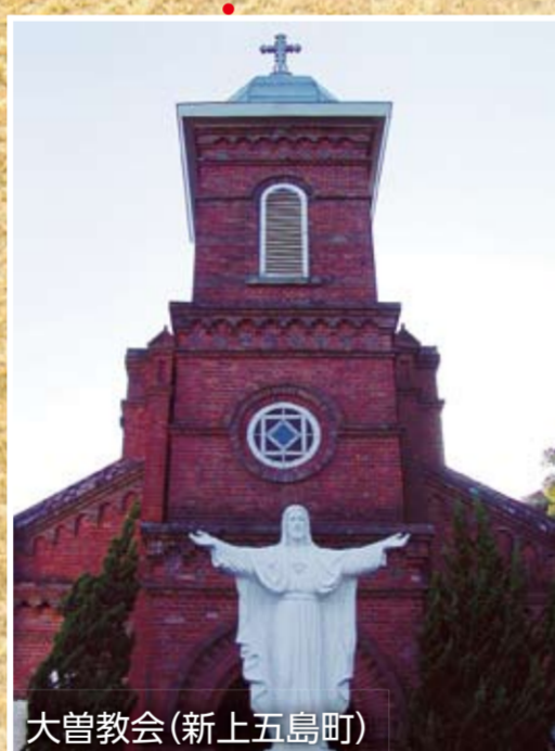
大曾教会(新上五島町)