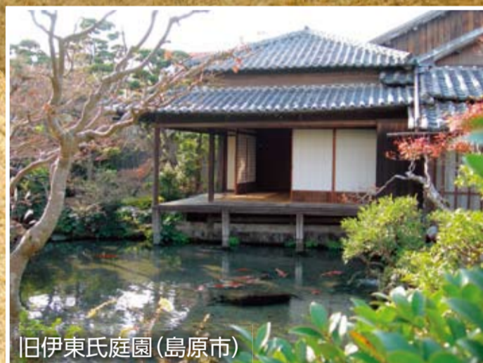
旧伊東氏庭園(島原市)